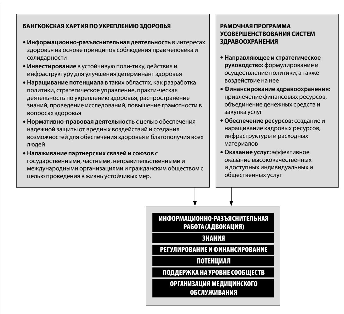
Рисунок 1. Комплексная рамочная программа действий в области НИЗ

торить или заменить эти стратегии и планы действий, а скорее воспользоваться их опытом, обеспечить их более эффективную реализацию и сотрудничество для достижения общей цели. В этой